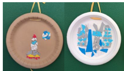
「モザイクアート」 ひまわり4年生児童