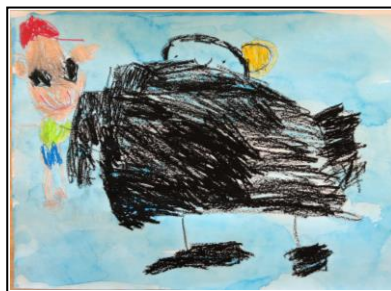
「ペンギンをみたよ」