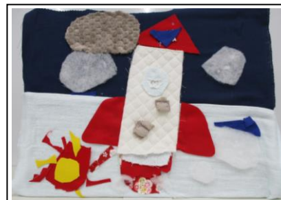
「ロケットにへんしん!!」