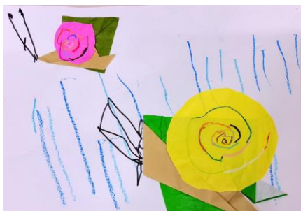
「雨の日のかたつむり」 ひまわり1年生児童

と、言いました。わたしはまっすぐ手 をあげました。ショーに出ようと待っ ていたら、べつの人が当たりました。 わたしは、がっかりしました。とつても 楽しかったけれども、たつまきに入っ ていたら、もっと楽しかったと思いま す。