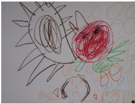
「おにが きた！」 4歳児

卒業生のみなさんとなかなか会うことができなくなることは、とてもさみしく思います。が、中学生になっても元気でいつも笑顔でいてください。今までありがとうございます。