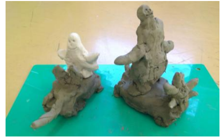
「ライオンと象と僕とで公園に行くよ」 1年生児童