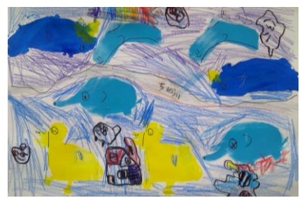
「たのしいみんなの水ぞくかん」 2年生児童