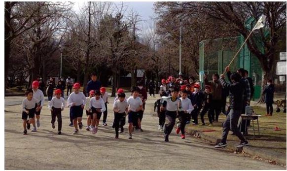
中学年「ミニマラソン大会」