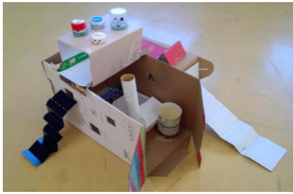
「滑り台のあるお家」 2年生児童