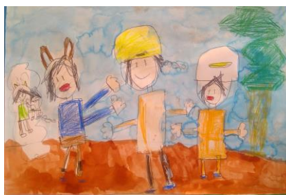
「ぼくのすきなばめん」 2年生児童