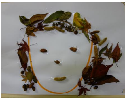
「はっぱやきのみでかおをつくったよ」