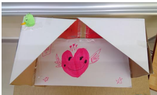
「インコのまんが入れ」 4年生児童

二位は無理だったけど、目標タイムに近かった。全力をつくして三位を取れたから、ぼくはとってもうれしかった。