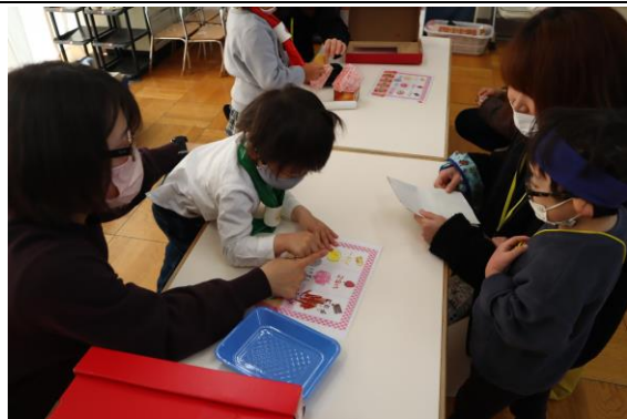
「おみせやさんごっこ クッキーや」