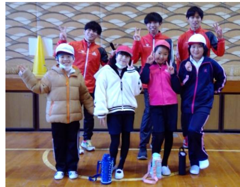
「ランニング教室」 4年生児童