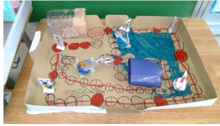
「すごろく」 2年生児童