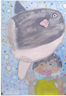
「マンボウとぼく」 1年生児童